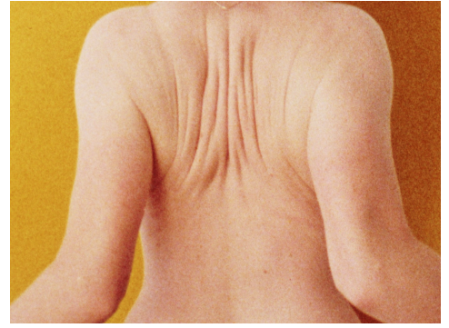
Een weefsel van licht , 2021 10'50" / super8 / kleur / geluid

Museum of Moving Image, New York. 2024 XINEMA 'To carve without cutting', Canada. 2024 Luxor Theater, Zutphen. 2024 Sunday Shorts @ Volkshotel, Amsterdam. 2023 Fest. Cinema des Différents et Exp. Paris. 2023 Nederlands Film Festival. 2023 Karlovy Vary Int. Film Festival, Tjechië. 2023