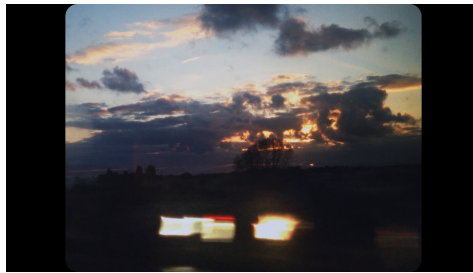
No Service , 2017 10'40" / hd / kleur / geluid

Forum des Images, Parijs. 2024 Milan Machinima Festival. 2019 HSE Art Gallery, Moskou. 2019