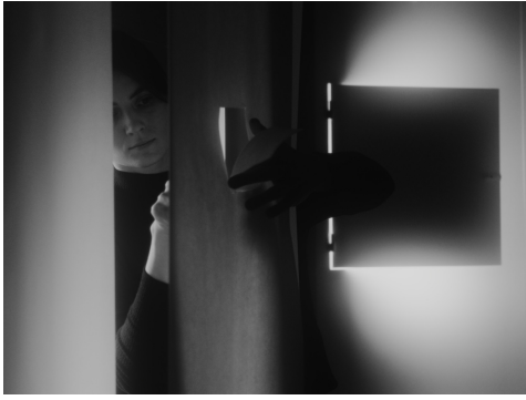
Is All Around , 2024 3'28" / hd / kleur & zwart-wit / geluid

Mijn films worden gedistribueerd door Collectif Cinema Du Jeune, Parijs.