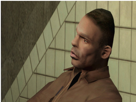
Perpetual Spawning , 2018 5'41" / hd / kleur / geluid

Fest. Cinema des Différents et Exp. Paris. 2022 Nederlands Film Festival. 2022 Karlovy Vary Int. Film Festival, Tjechië. 2022 Pesaro Film Festival, Italië. 2022 Viennale, Wenen. 2021 FestiFreak, Argentinië. 2021