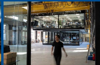
Perron 038